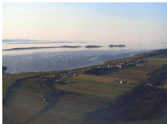
L'archipel des Pèlerins