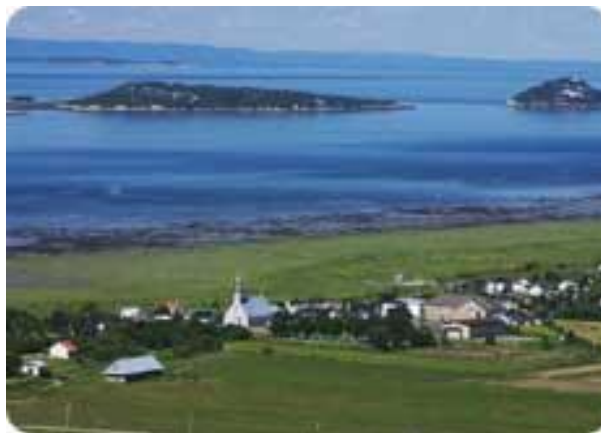
Les îles de Kamouraska