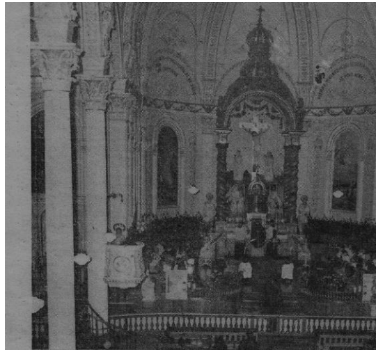
L'intérieur de l'église de Saint-Pascal

Située sur la Rive Sud du Saint-Laurent, à 92 milles à l'est de la Cité de Québec et à 27 milles à l'ouest de la Cité de Rivière-du-Loup, cette belle paroisse du diocèse de Sainte-Anne compte plus de 125 ans d'existence.